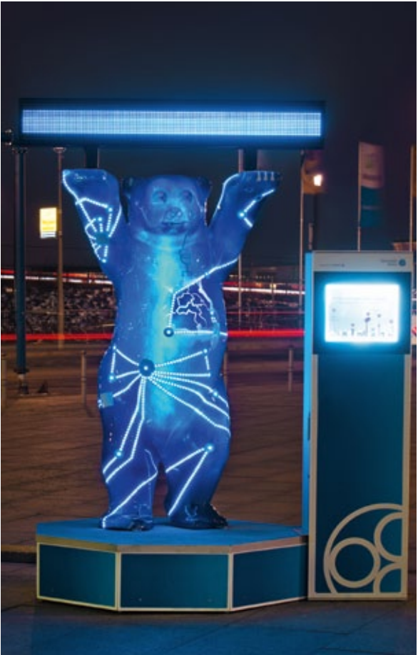
Hingucker: der Strombär bei Nacht